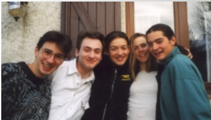
Pnoudt, Znarf, Zouillega, Didine, T.

Si vous aussi cela vous intéresse, demandez nous une fiche d'inscription pour faire partie des nôtres et ainsi jouir de nos services.